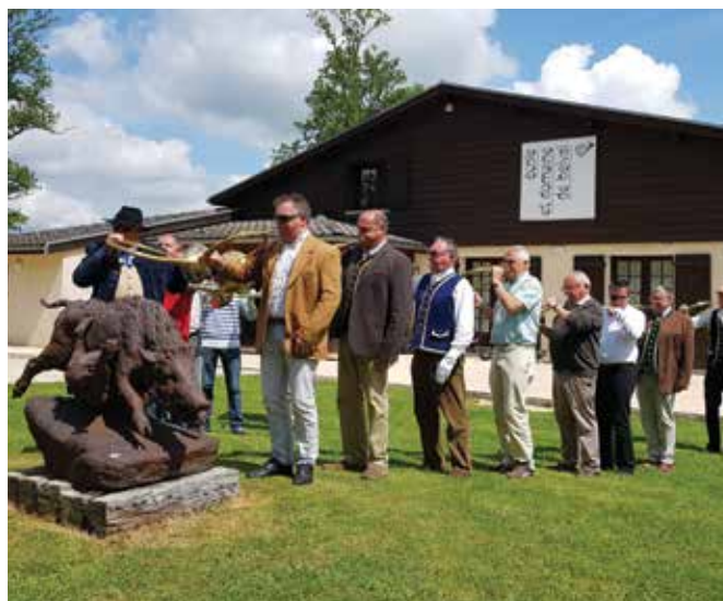
Stage de trompes à Belval (08) - Week-end de Pentecôte